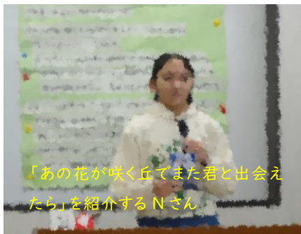
「あの花が咲く丘でまた君と出会えたら」を紹介するNさん