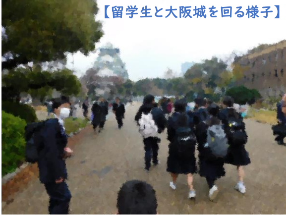
【留学生と大阪城を回る様子】

3日目は留学生の方々と大阪の街を回りました。エネルギーが溢れる街で、おいしいたこ焼きに舌鼓を打った班も多かったようです。