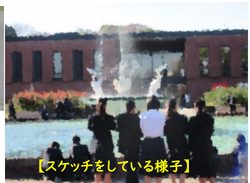
【スケッチをしている様子】